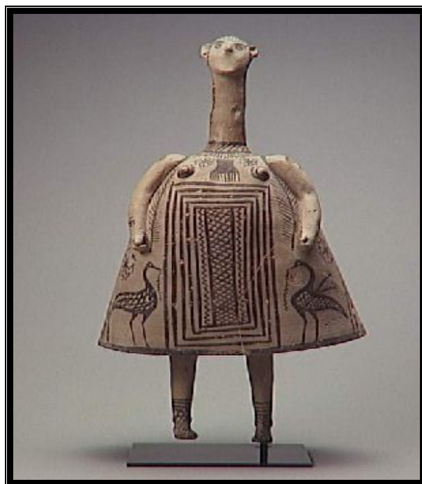
Idole-cloche de Bétotie

les discours actuels, serait susceptible de déterminer le devenir de ce que nous appelons « sujet » ».