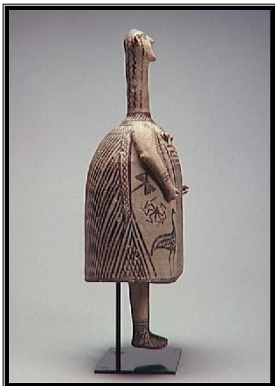
Idole-cloche de Béotie