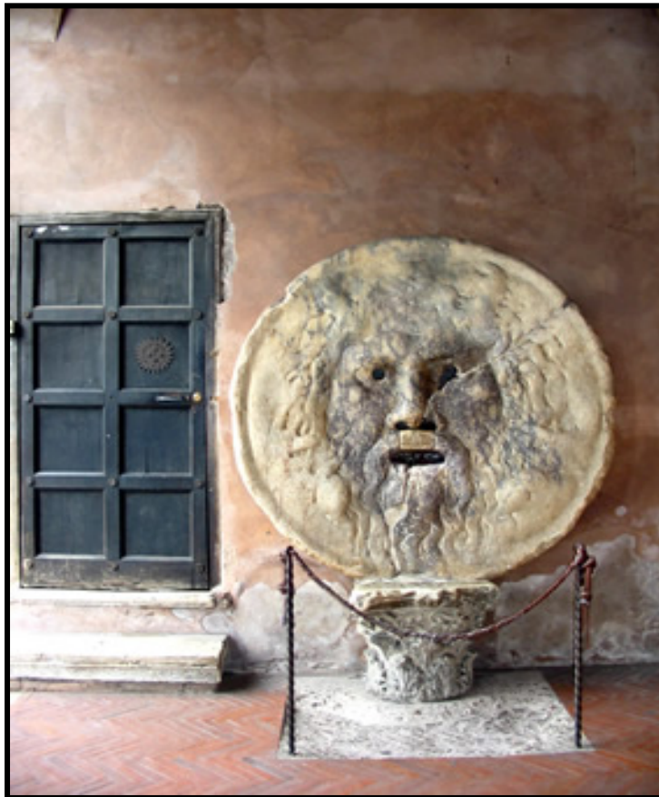
La bocca della verità (Rome)

Site du GRP: www.groupe-regional-de-psychanalyse.org