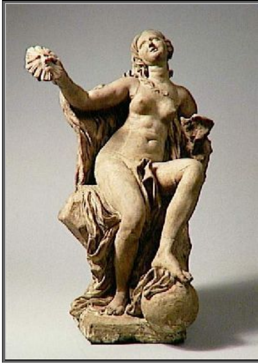
La vérité dévoilée, Le Bernin

« Ecoutez, je vous en donne le secret. Moi la vérité, je parle »