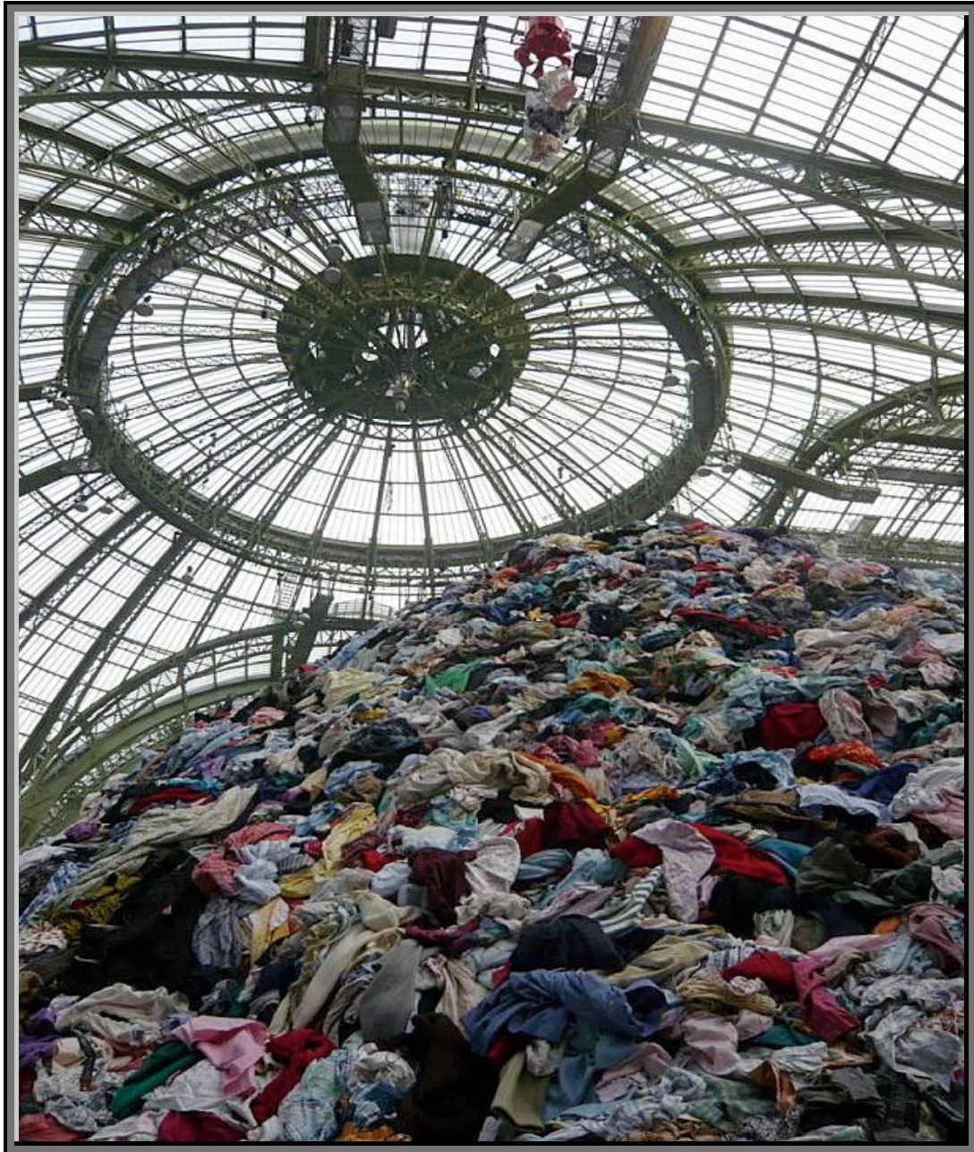
« Personnes », C. Boltanski