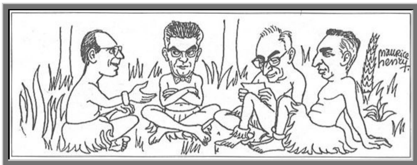
Michel Foucault, Jacques Lacan, Claude Lévi-Strauss, Roland Barthes (1967)

Site du GRP : www.groupe-regional-de-psychoanalyse.org