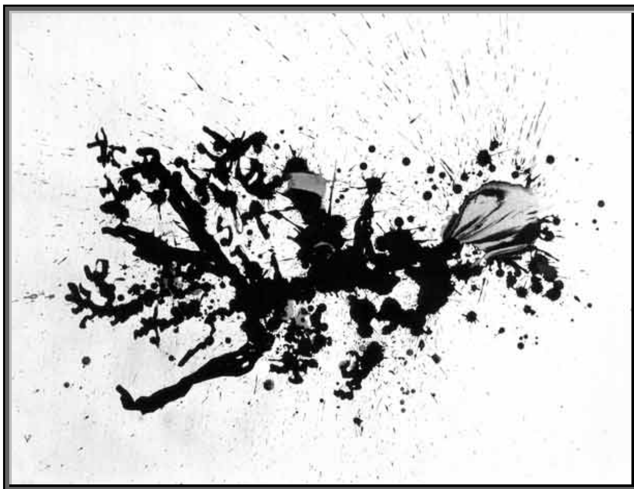
Henri Michaux - Eclatements

Site du GRP : www.groupe-regional-de-psychanalyse.org