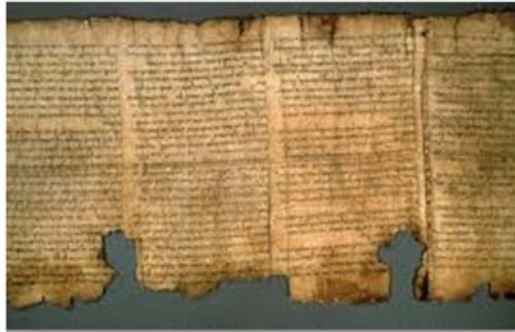
Les manuscrits de la Mer morte

« Le plus fort, c'est que c'est une idée qui se confirme de ceci, que la langue n'est efficace que de passer à l'écrit. »