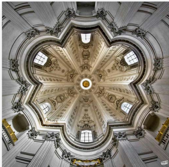
St'Ivo alla Sapienza Rome

Pour Borromini en perspective et son esthétique baroque.